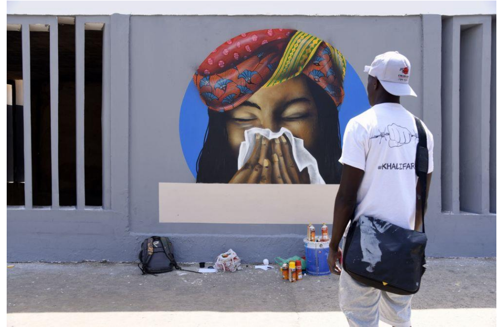
Senegalo grafitistai „RBS CREW“ piešia ant Dakaro universitetinio menų centro sienų