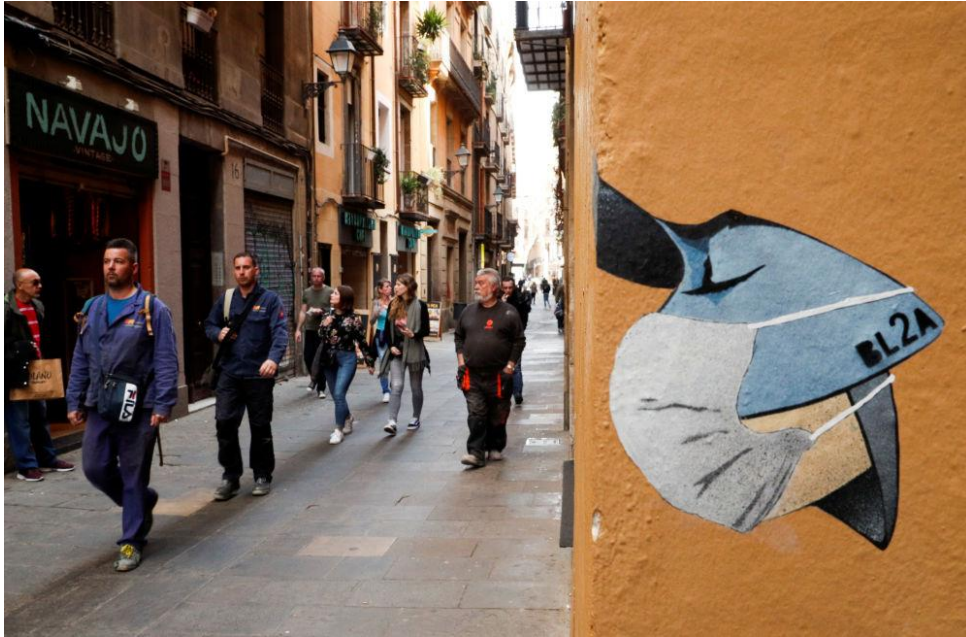
Žmogaus su kauke piešinys ant sienos Barselonoje, Ispanijoje.