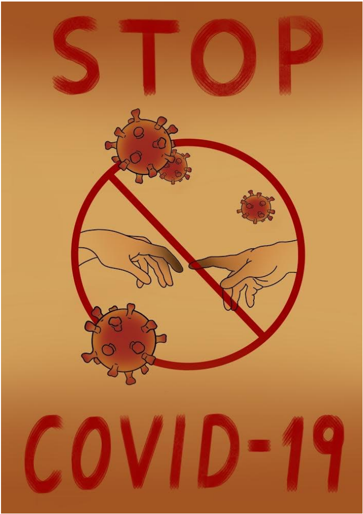
A. Alytė, 3a kl.