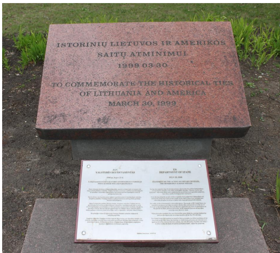
A memorial stone of Lithuanian-American friendship/ Lietuvos ir Amerikos draugystės atminimo akmuo