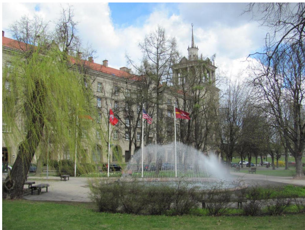
Washington Square in Vilnius/ Vašingtono aikštė Vilniuje