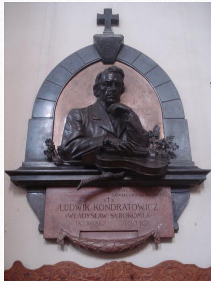
Pomnik Syrokomli w kościele Św. Jana w Wilnie