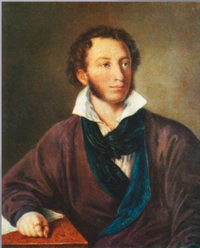
В. Тропинин. Пушкин. 1827 г.