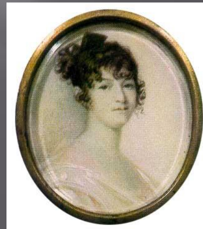
Мать, Надежда Осиповна Пушкина (1775-1836г.)