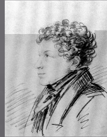
Брат, Лев Сергеевич Пушкин (1805-1852г.)