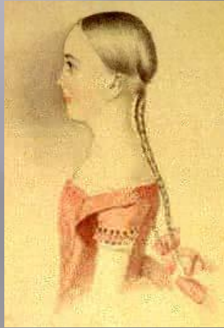
Старшая дочь, Мария Александровна Пушкина (1832-1919г.)