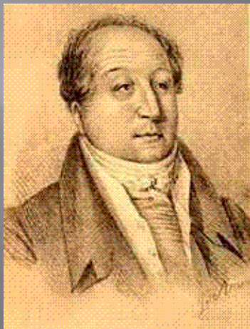
Дядя, Василий Львович Пушкин (1766-1830г.)