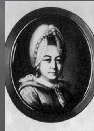
Бабушка, Мария Алексеевна Ганнибал (1745-1818г.)