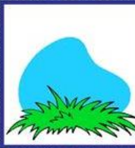
das Gras, -"-er