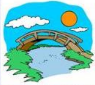
die Brücke, -n