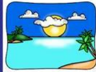
das Meer, -e