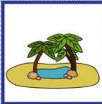
die Oase, -n