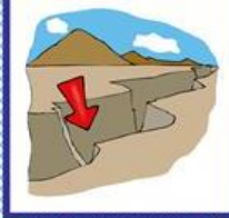
die Schlucht, -en