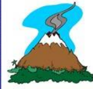
der Vulkan, -e