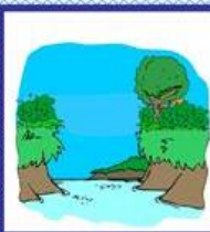
der Fluss, -"-e