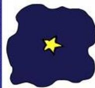
der Stern, -e