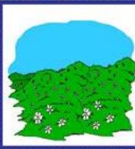
die Wiese, -n