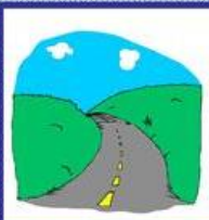
die Straße, -n