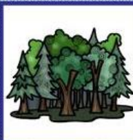
der Wald, -"-er