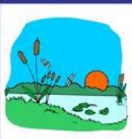
der Teich, -e