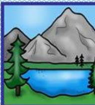
der See, -n