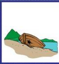
das Ufer, -