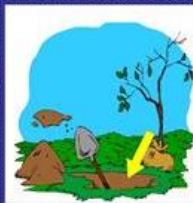
das Erdloch, -"-er