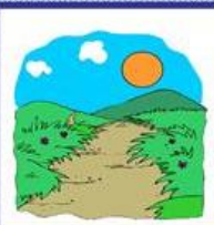
der Weg, -e