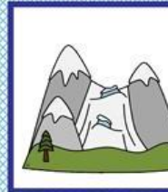
der Gletscher, -