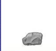
der Stein, -e