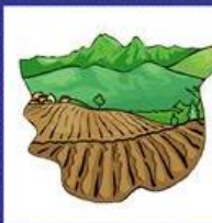
das Feld, -er