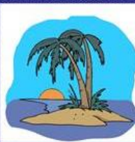
die Insel, -n