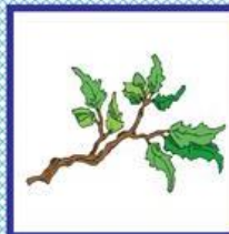
der Ast, -"e