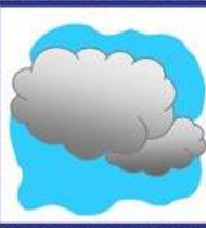
die Wolke, -n