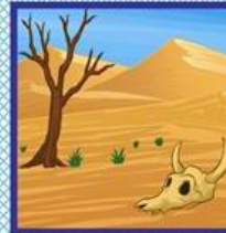
die Wüste, -n