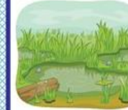
der Sumpf, -"e