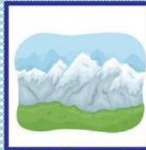
das Gebirge, -