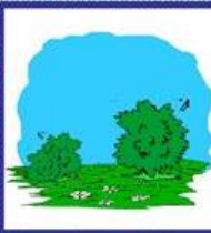
der Strauch, -"-er