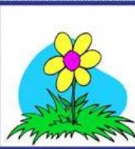
die Blume, -n