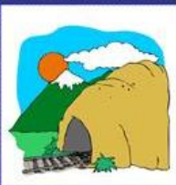
der Tunnel, -