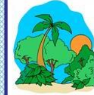
der Dschungel, - der Regenwald, -"er