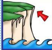
die Klippe, -n