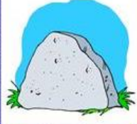
der Felsen, -