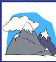
der Berg, -e