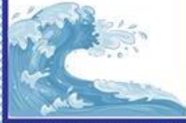
die Welle, -n