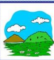
der Hügel, -