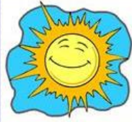
die Sonne, -n