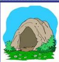
die Höhle, -n