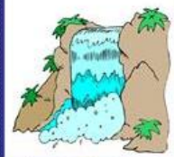
der Wasserfall, -"-e