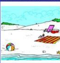
der Strand, -"-e