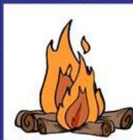
das Feuer, -