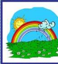
der Regenbogen, -"-