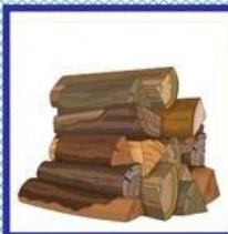
das Holz, -"er